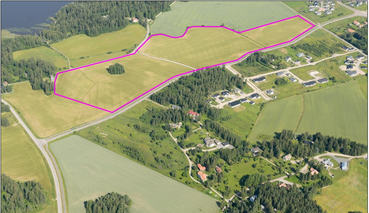
Suunnittelualueen rajaus viistoilmakuvalla.

Kukkilan (23) kunnanosa, tilaa 98-414-1-1056 ETELÄ-TAKALA koskeva asemakaava.